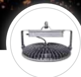
옵션 펜던트 타입