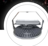
기본 벽부 타입